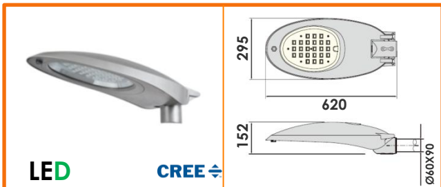
LUMINARIA RADIAL D-150S