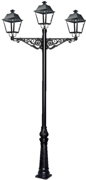
Conjunto 1: Columna Cartuja Con 2 Brazos Villa+ 3 Farol Villa