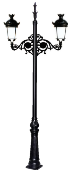
Conjunto 4: Columna Cartuja Con 2 Brazos Fernandino Aluminio +2Farol Fernandino 850m/m+Remate.