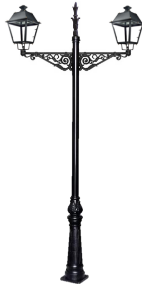
Conjunto 2: Columna Cartuja Con 2 Brazos Villa+ 2 Farol Villa Y Remate Superior.