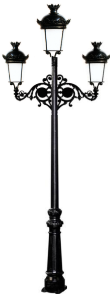
Conjunto 3: Columna Villa Con 2 Brazos Fernandino Aluminio +3 Farol Fernandino 850m/m