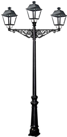
Conjunto 1: Columna Villa Con 2 Brazos Villa+ 3 Farol Villa