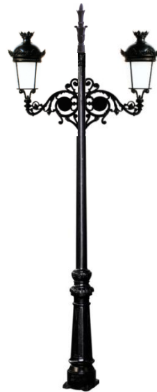
Conjunto 4: Columna Villa Con 2 Brazos Fernandino Aluminio +2Farol Fernandino 850m/m+Remate.