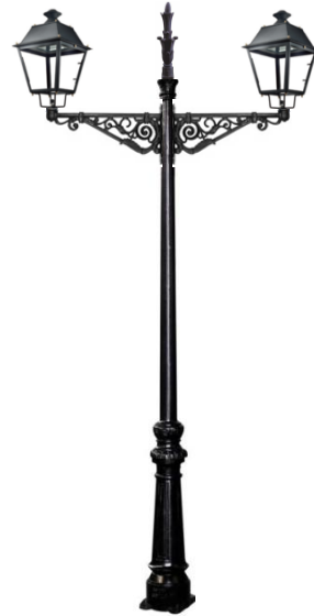
Conjunto 2: Columna Villa Con 2 Brazos Villa+ 2 Farol Villa Y Remate Superior.