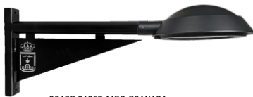
BRAZO PARED MOD.GRANADA RAL 9005 NEGRO+ECA D-32 LED VIAL

COMO OPCIONAL GRABADO LASER ESCUDO CIUDAD