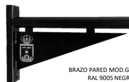
BRAZO PARED MOD.GRANADA RAL 9005 NEGRO

COMO OPCIONAL GRABADO LASER ESCUDO CIUDAD