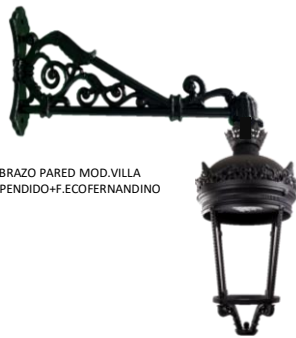
BRAZO PARED MOD.VILLA SUSPENDIDO+F.ECOFERNANDINO