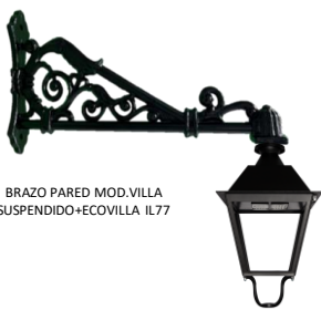
BRAZO PARED MOD.VILLA SUSPENDIDO+ECOVILLA IL77