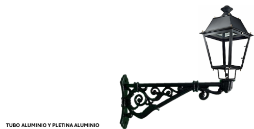
TUBO ALUMINIO Y PLETINA ALUMINIO