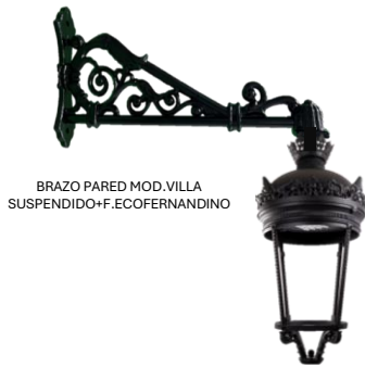
BRAZO PARED MOD. VILLA SUSPENDIDO+F.ECOFERNANDINO