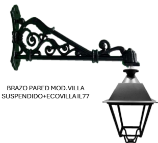
BRAZO PARED MOD. VILLA SUSPENDIDO+ECOVILLA IL77