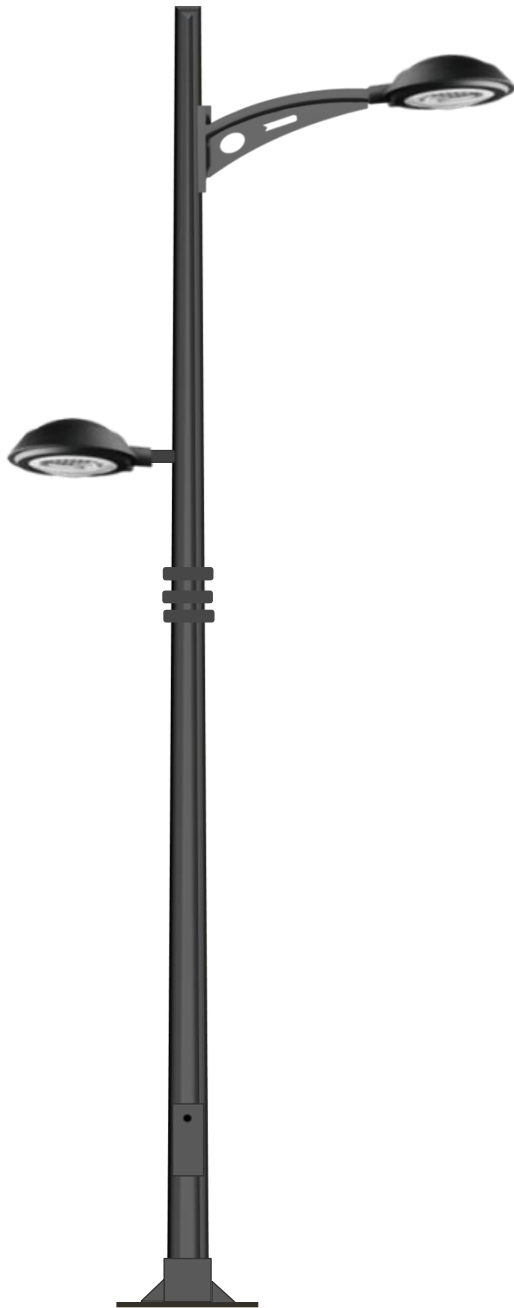
CLT-BL2+ECA D-32 LED

FAYCOBA Alumbrado publico LED 958-420-356 www.faycoba.com