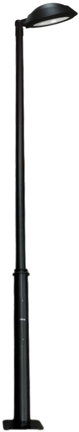
CL.OPORTO+ECA D-32 REF-CL-OPCT