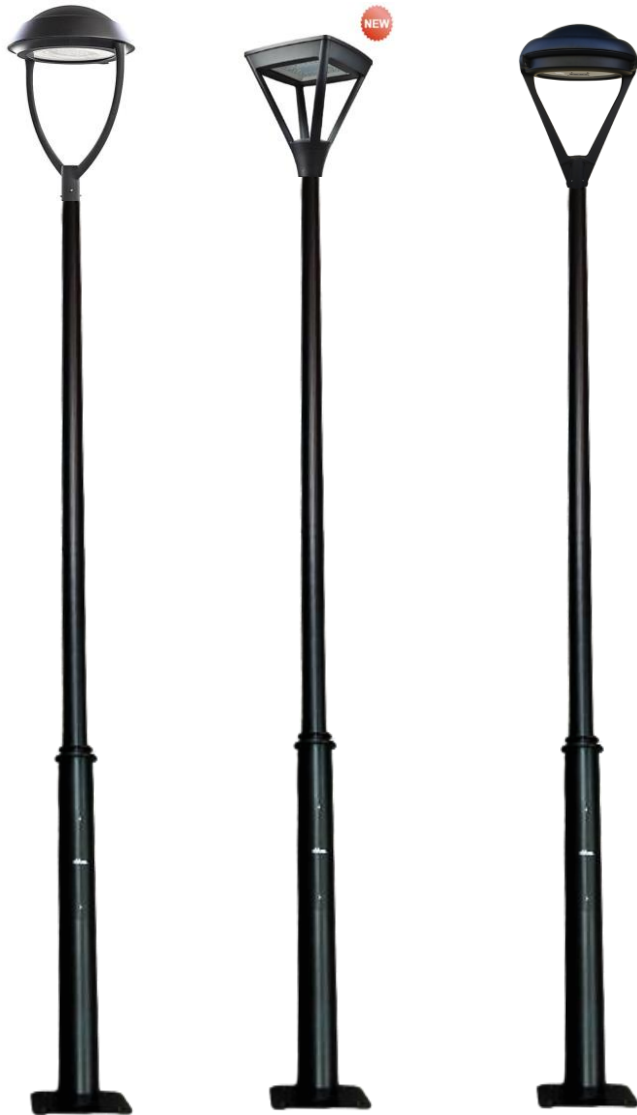
OPORTO+ECA INVERTIDA D-32L LED