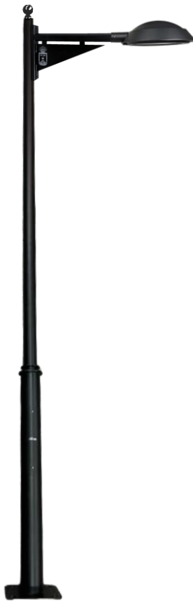
CL.OPORTO+BRAZO GRANADA+ECA D-32 REF-CL-OPCT