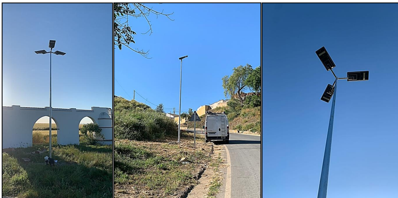
LUMINARIA SOLAR IVAP P-60W LED